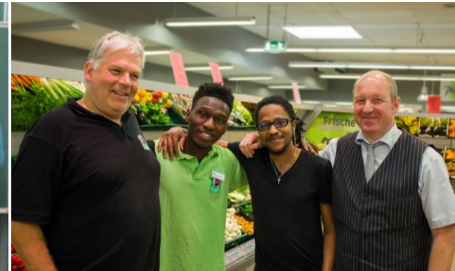
NETWORK Enterprises Integrating Refugees