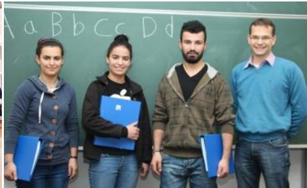
Activities, measures and commitment of CCI